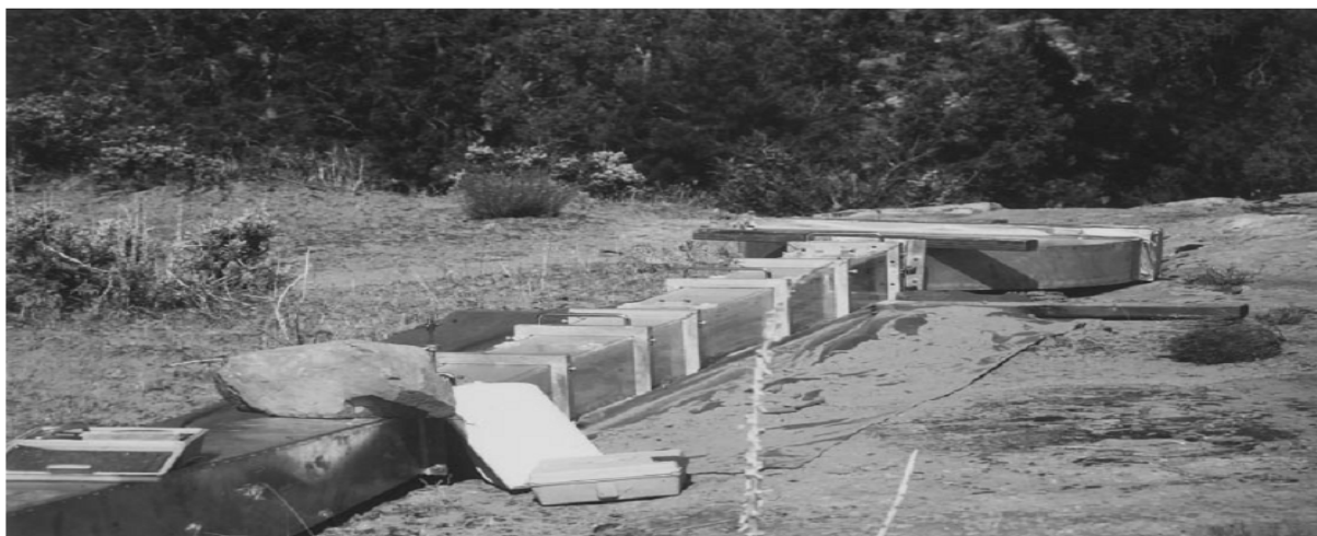
شکل 1. تونل بادی قابل حمل، مونتاژ در این زمینه.

(3) تیمار V2: عبور دوباره یک وسیله چرخ با تایر اج دا.