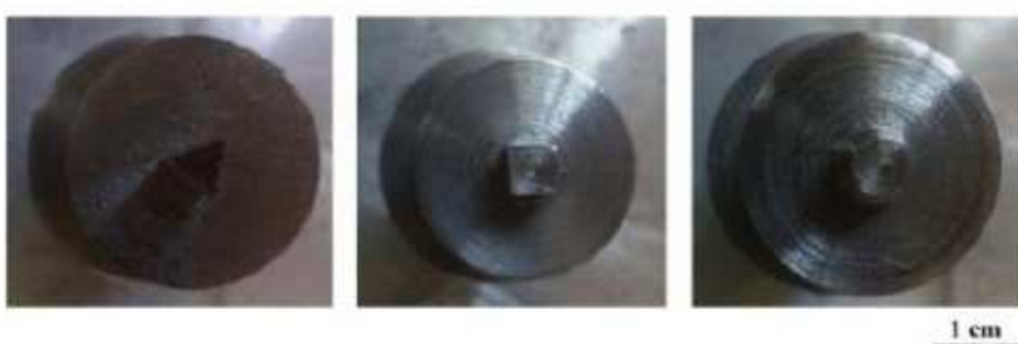
شکل 1 - برش های عرضی پین ابزار FSW.