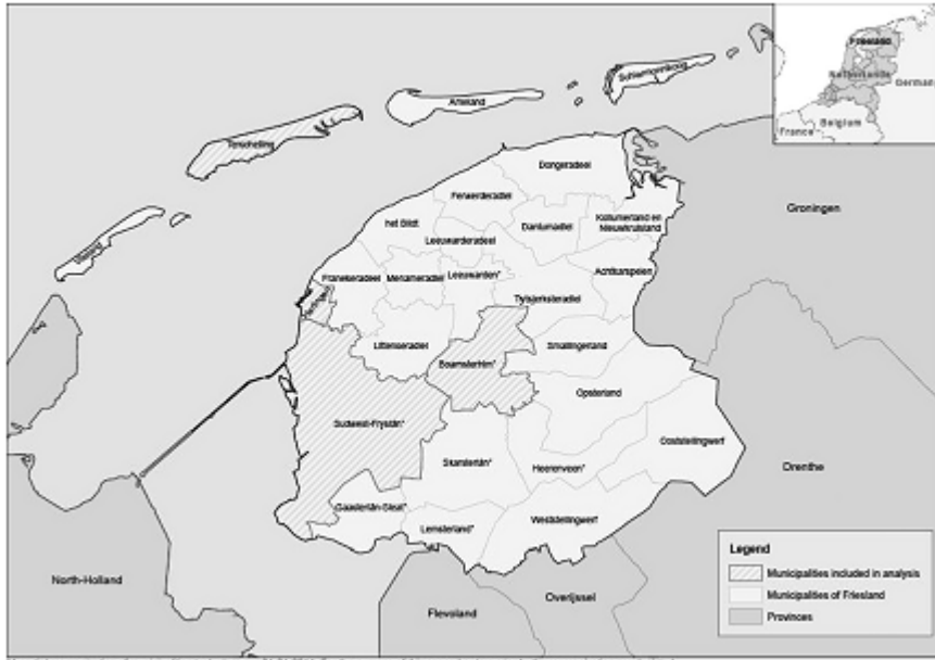
شکل 2- نواحی شهری فریسلین

جدول 1- سفرهای روزمره ساکنان به ازای استان سکونت و استان بازدید شده در هلند شمالی