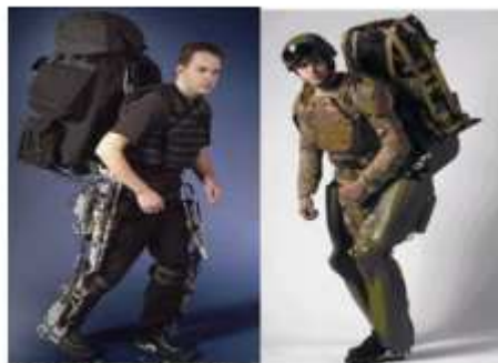
شکل 1: BLEEX دانشگاه کالیفرنیا، برکلی

در سال 2004، گروهی به رهبری دکتر کازارونی از UCB، سیستم BLEEX را گزارش کرد که توسط پروژه EHPA از DARPA پشتیبانی می شد. این سیستم اولین اگزواسکتون کارکردی با بدن انسان در داخل آن بود.