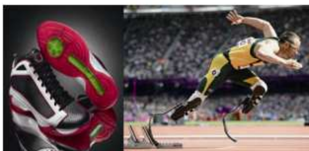
شکل 9: کفش های APL و اندام مصنوعی الاستیک OSSUR

فیبری بدون کنترل مصنوعی است. تسی برای مقایسه افرادی که از آن استفاده می کردند توسط پیتر برگرن از دانشگاه جرمن اسپورت در کولن آلمان انجام شد(61). نتایج نشان داد که فرد هنگام دویدن با سرعت خاص، 25 انرژی کم تری در مقایسه با افراد سالم مصرف می کند وقتی که سرعت افزایش می یابد انرژی حاصل از این پروتز سه برابر بیشتر از یک مفصل قوزک انسانی می رسد. افت انرژی ناشی از این اندام مصنوعی تیغه ای شکل 9.3 سه درصد در مقایسه با 41.4 درصد مفصل قوزگ انسان بود که انرژی مکانیکی نسبت به مفصل قوزک سالم بیش تر از 30 درصد بود.