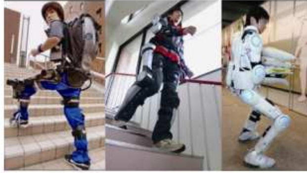
شکل 4: سری های HAL دانشگاه سوکوبا

HAL-1 در 1999 توسط دانشگاه اعلام شد (25). HAL-3 در سال 2001 رونمایی شد و در سال 2005، نسخه های تجاری HAL-5 در Aichi Expo (25) معرفی شد. HAL-5 یک اگزواسلکتونی کامل با وزن 147 نیوتون (27) بود. فریم آن متشکل از الیاژ آلومینیوم با اجزای فولادی در مفاصل بود. HAL-3 دارای شش مفصل، بود و زانو ها و کفل ها با موتور های DC کار می کردند و قوزک ها توسط فنر هایی پشتیبانی می شد که موجب افزایش پایداری بدن می شد (28). درجه حرکت موجب شد تا هر یک از مفاصل بر اساس میزان قابلیت مفاصل بدن برای پیش گیری از آسیب انعطاف خود را افزایش دهد. HAL-5 دارای ساختار اندام فوقانی مشابه با HAL-3 بود و جدیداً عملکرد تحمل بار نیز به این اندام افزوده شده است.