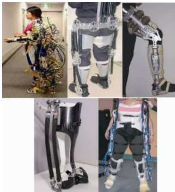
شکل 6: دستکاه های آزمایشی که با سیستم پنوماتیک کار می کنند

این طرح ها با موفقیت هایی همراه بودند و کار های آن ها عمدتاً بر مطالعه روش های کنترل تاکید داشتند با اما برخی از نتایج آن ها مشابه یک دیگر بود.