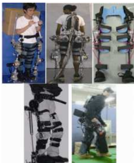
شکل 5: ابزار های آزمایشی که با موتور های الکتریکی کار می کنند.

[30] , [31]IHMC , PAS [32] و [33-34]WWH-KH توسعه دادند. این سیستم ها دارای خصوصیات خاص خود می باشند و هنوز به صورت نمونه های آزمایشگاهی دیده می شوند(شکل 5).