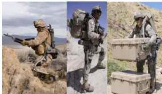
شکل 2: HULC از لوکید مارتین

در اوایل 2006، ExoHiker به HULC(22) تغییر نام یافت (شکل 2) و برای عموم معرفی شد. اگرچه عملکرد اندام فوقانی نیز به آن افزوده شد پیشرفت های کمی در این سیستم دیده شد. بعد از انف پیشرفت زیادی در HULC گزارش نشد.