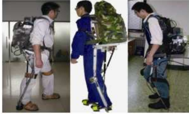
Fig. 7. Engineering attempts in China