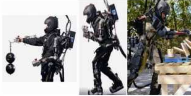
شکل XOS:3 از سارکوس

در سپتامبر 2010، Raytheon یک نسخه جدید را موسوم به XOS-2 معرفی کرد. این سیستم جدید از سیستم هیدرولیکی نظیر قبلی ها استفاده کرده و در آن تعداد زیادی از سنسور ها، واحد های اجرایی و کنترل گر ها استفاده شود. تستر با پوشیدن این سیستم قادر به بلند کردن وزنه 890 نیوتونی برای صد بار بدون هر گونه خستگی بود. تستر ها هم چنین قادر به خرد کردن تخته های چوبی 76.2 میلی متری بودند. به علاوه، سیستم جدید سبک تر، سریع تر و قوی تر بود و مصرف انرژی تا 50 درصد کاهش داد. با این حال، معایب اصلی XOS-2 این بود که انرژی بیشتری مصرف می کرد و این موجب می شد تا استفاده از یک منبع انرژی توکار غیر ممکن بود. به پشت آن یک زائده دم مانند وصل می شد که موجب می شد تا تستر یا فرد از مسیر خارج نشود. با این حال طراح آن بر این باور بود که این یک مسئله مهندسی پیش پا افتاده است و می توان سریعا بر آن غلبه کرد. تاکنون، گزارش های XOS-2 نشان داده اند که این زائده موجب بروز مشکل می شود.