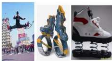
شکل 11: کفش های الاستیک و لوازم ورزشی

در صورتی که مفهوم را بسط دهیم، هر گونه ابزار برای بهبود توان و قابلیت فیزیکی افراد را می توان به صورت اگزواسکتون غیر فعال در نظر گرفت. شولدر پول، ، طرمبلنس، صبرنجبوردس و مستسز ابزار هایی هستند که می توانند تجربه مناسبی را برای طراحی اگزواسکتون ها در اختیار بگذارند. در واقع آن ها اگزواسکتون های غیر فعال می باشند که در دستگاه های ورزشی و سرگرمی استفاده می شوند و در منابع مطالعات زیادی در مورد آن ها صورت گرفته است.