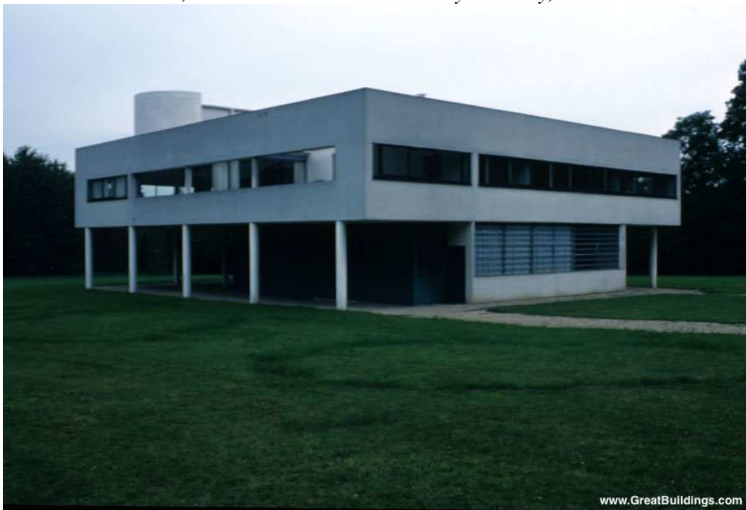
Southeast corner · Villa Savoye · Poissy, France