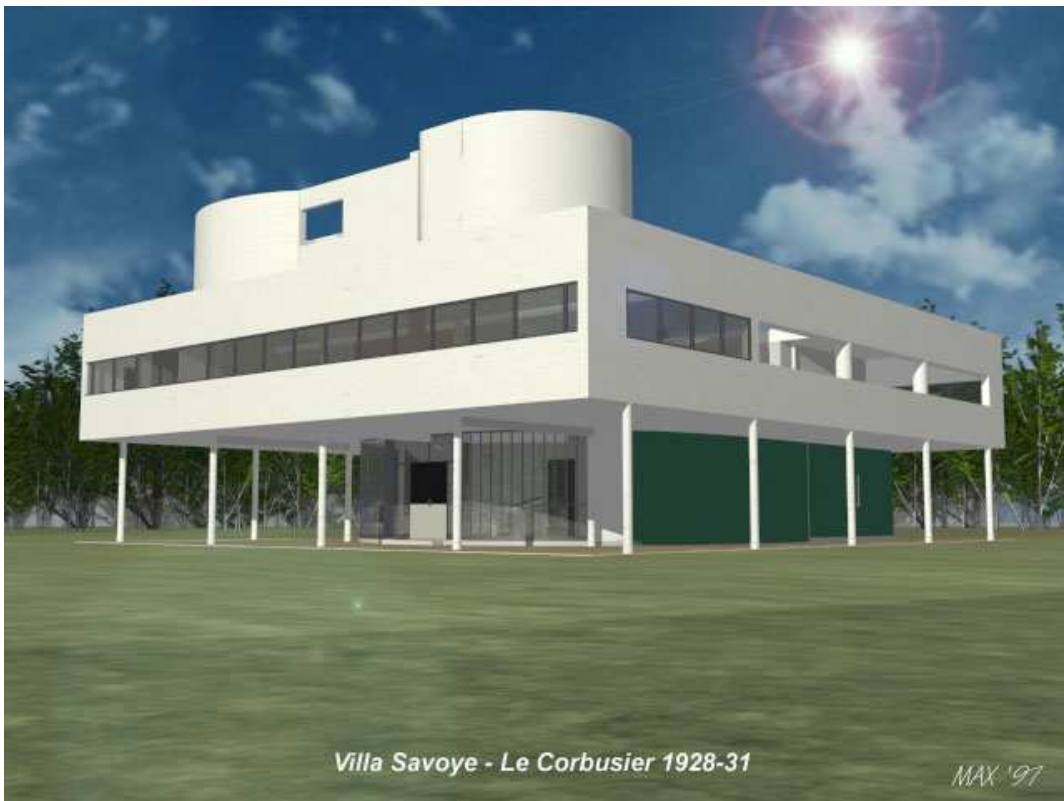
Villa Savoye - Le Corbusier 1928-31